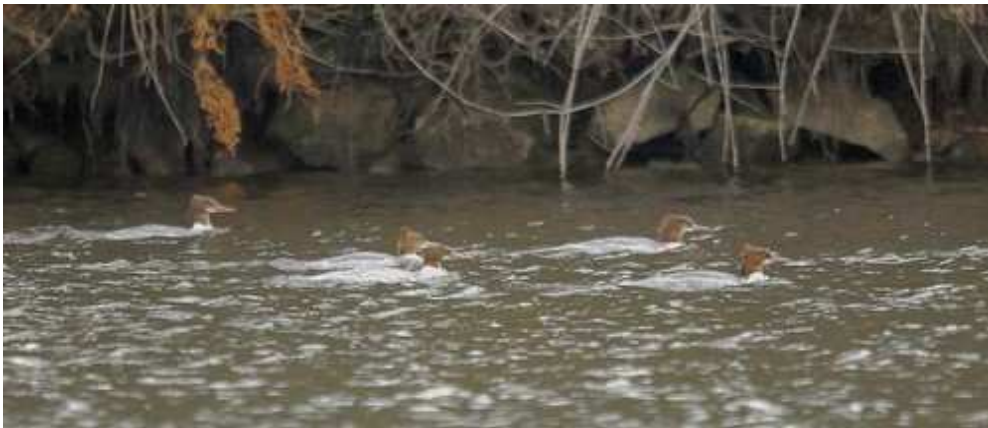
Photo 6 : Harles bièvres, Mergus merganser , Saint-Pardoux (87), décembre 2010

Un afflux de Harles bièvres est survenu lors de l'hiver 2010/2011 à nos latitudes, on notera que tous les oiseaux cités sont de type femelle.