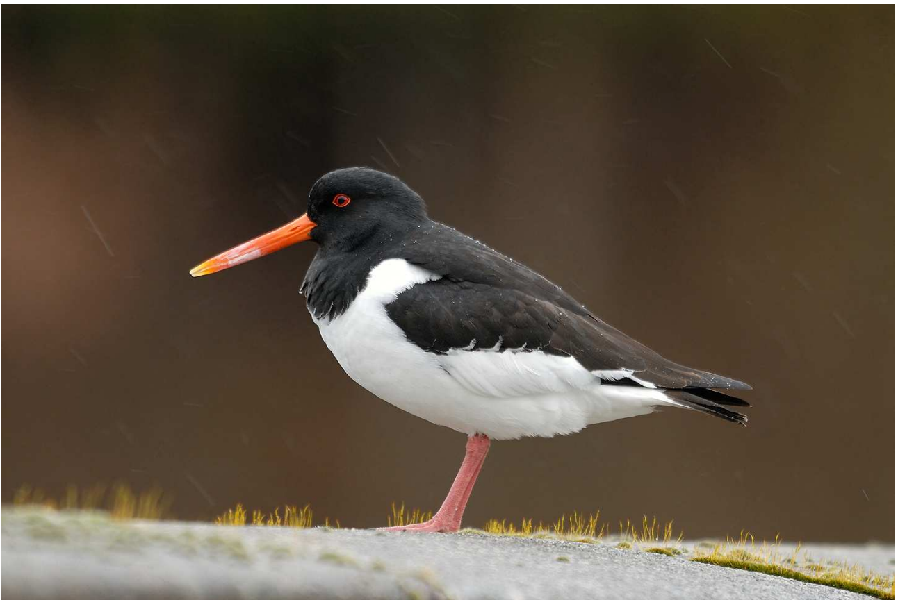
Huîtrier pie, Haematopus ostralegus , Saint-Sylvestre (87), février 2010.

2 ème rapport du Comité d'Homologation Régional du Limousin