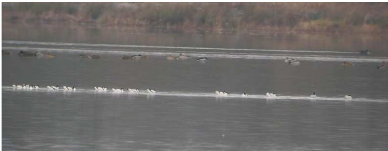
Photo 15 : Avocettes élégantes, Recurvirostra avosetta , Lussat (23), novembre 2010.

Ces observations correspondent à des oiseaux en halte migratoire. On notera que fin novembre un groupe de 99 avocettes stationnait à l'étang de Sault dans l'Allier, à 30 km de l'étang des Landes (Obs Stéphane Combaud, LPO Auvergne).