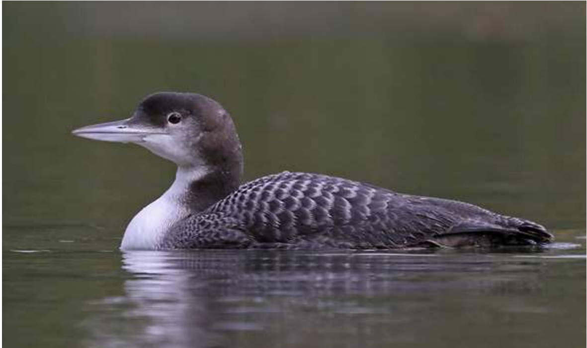
Photo 8 : Plongeon imbrin, Gavia immer , Chasteaux/Lissac (19), décembre 2010.